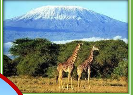
＜タンザニアの世界遺産＞