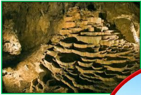
＜スロベニアの世界遺産＞