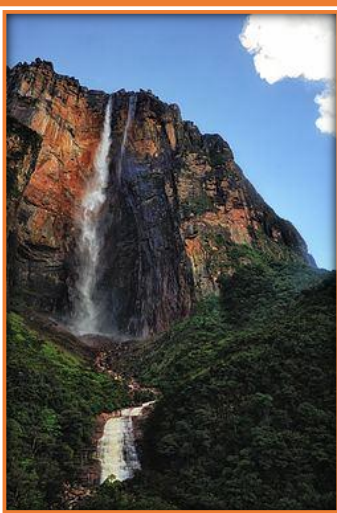
＜ベネズエラの世界遺産＞