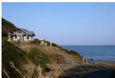
世界遺産登録が期待される 『神宿る島』宗像・沖ノ島と関連遺産群 (左) 宗像大社辺津宮 (右) 宗像大社沖津宮遥拝所

世界遺産に関する普及活動を行う弊法人では、企業・大学・生涯学習センター等で世界遺産の講座を持つ研究員(次ページ)が、本件について下記のような内容のコメントをご提供可能です。