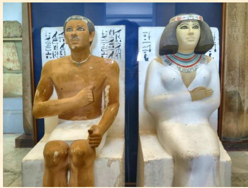
ラーヘテプとネフェルトの座像