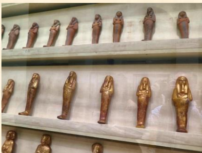
ウシャブティと カノプス壺