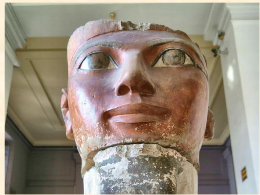
ハトシェプストのオシリス柱頭部