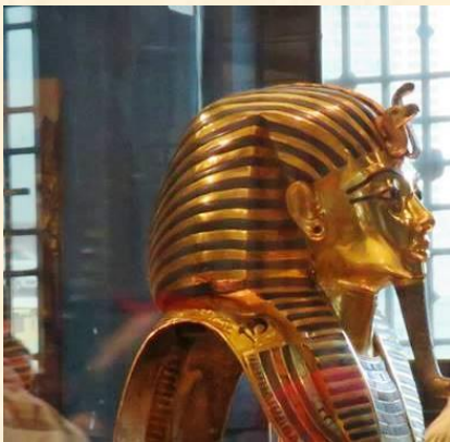
ツタンカーメンの黄金のマスクと王座