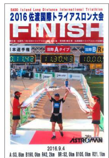
2016年9月「佐渡国際トライアスロン」では、 3年間で腰と膝を5回手術後、リハビリの末の完走

界遺産学習の入口に立っていただく。それから、知識を深めていただく。そのサポートが認定講師である私たちの役割でしょう。教える際は、過去の失敗も役立ちます。前述の1級不合格、トライアスロンとウルトラマラソンでの棄権に失格など、私の人生には「負の経験」が豊富です。成功には嘘があり、失敗には真実があります。平地で仰ぐ富士山は遙か彼方にありますが、1歩1歩進めば、頂上が近づいてきます。本当にきついのは頂上が見えてからですが、諦めずに歩くのです。世界遺産学習は、トライアスロンと似ているように感じます。まずはスタート位置に立ち、自分の可能性を信じる。奇跡は起きない、しかし、起こすことはできる。最後は、“頑張らないけれど、諦めはしない”の信条で、締めくくりといたします。