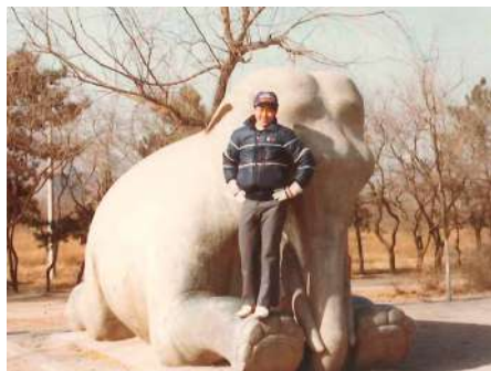
明の十三陵。後に世界遺産となる石像も、 当時は規制もない。訪れるのは外国人ばかり

唐の文成公主がチベットの吐蕃王に嫁ぐ際、かの地に別れを告げた標高3,500mの日月山にも登りました。シルク・ロードや玄奘三蔵の道を追い求め、敦煌では、今では非公開の石窟も鑑賞し、