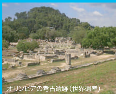
オリンピアの考古遺跡 (世界遺産)