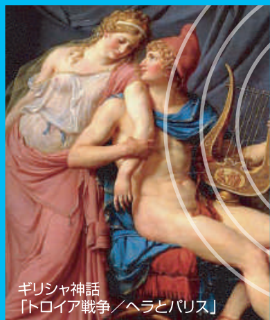
ギリシャ神話 「トロイア戦争／ヘラとパリス」