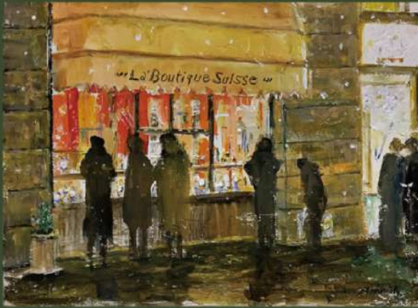
《冬の黄昏クリスマスの頃〜プラハにて》 F4