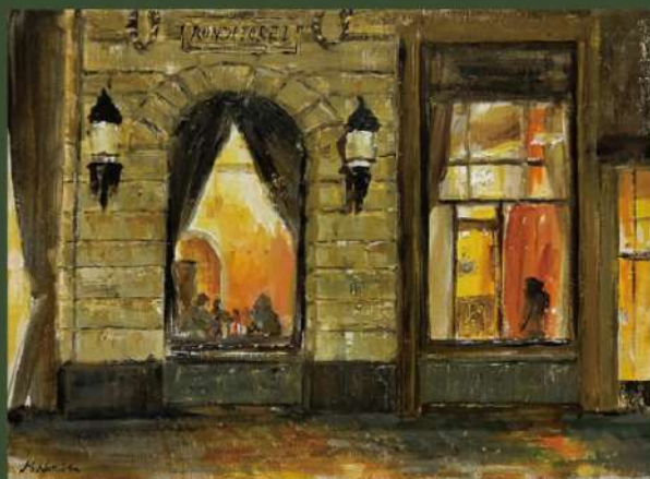
《沁みいる夜〜プラハにて》 F4

1966年千葉県生まれ サロン・ドートンヌ展やル・サロン展など入選歴多数。ヨーロッパではパリ、ジュネーヴ、セビーリャ、アメリカではニューヨーク、マイアミ、サンタフェなどで作品を発表。