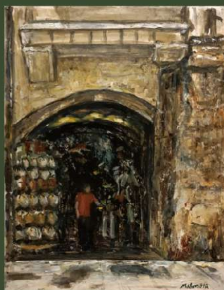
《昔ながらのみやげ店〜インスブルックにて》F6