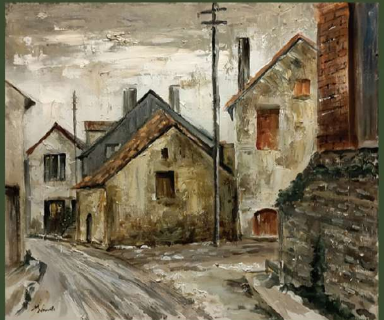
《修道士の村〜冬のフラヴィニー・シュル・オズラン》 F10