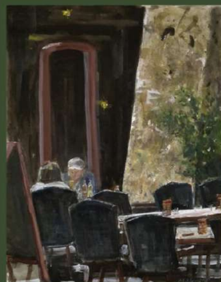
《午後の語らい〜インスブルックにて》F6