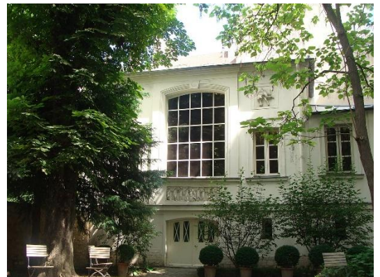
ウジェーヌ・ドラクロワ美術館