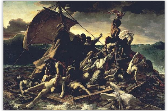
『メデュース号の筏』/テオドール・ジェリコー 1818年-1819年頃 ルーヴル美術館所蔵

パリには、ドラクロワを記念して建てられた「ウジェーヌ・ドラク ロワ美術館」があります。サンジェルマン・デ・プレ教会のすぐ近く で、瀟洒なアパルトマンのような佇まいです。ドラクロワがアトリエ として実際に住んでいた建物で、『民衆を導く自由の女神』の下絵 や、若い頃の作品なども展示され、とても見応えがあります。作品だ けでなく、パレットも見ることができ、彼が好んだ色彩や制作の工夫 を垣間見ることができるのも、興味深いです。日本人観光客の姿はあ まり見かけませんが、ドラクロワの作品や生涯に関心がある方は、ぜ ひ訪れてみてください。