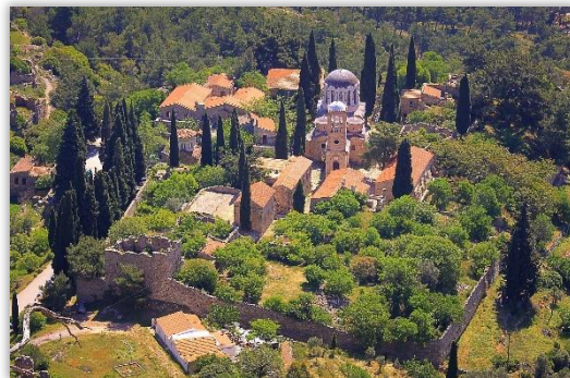
ネア・モニの修道院

そのため、キオス島は、あってはならない惨劇の舞台となったのです。『ダフニ、オシオス・ルカス、ヒオスのネア・モニの修道院群』の登録基準は、(ii)と(iv)です。主にビザンティン美術の影響や建築的価値などが評価されて登録されましたが、この せいさん 凄惨な出来事は考慮されていません。ネア・モニの修道院にはこのような背景があることを、記憶に留めてほしいと思います。女性や子供を含む1,000人以上の虐殺された人々が、この修道院に眠っているからです。貴重なモザイク画も破壊されました。負の遺産、記憶の場となってもおかしくない場所なのです。